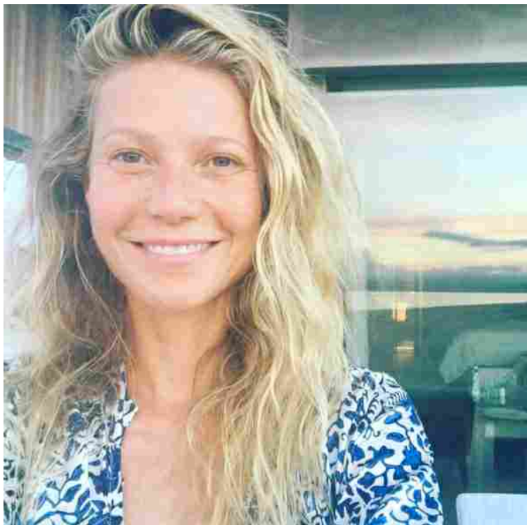
Dal profilo Instagram di Gwyneth Paltrow

trattamenti “fast”, veloci: dagli struccanti che rimuovono – oltre al maquillage – tracce di smog e tossine in un solo istante alle maschere defaticanti che agiscono in pochi minuti: sgonfiano le borse e distendendo lo sguardo. In istituto, il trattamento Endermologie “Sublimatore di Sguardo & Labbra” disintossica già in una seduta e ringiovanisce il contorno occhi, riattivando la sintesi naturale di collagene, elastina e acido ialuronico (65 euro, info: endermologie.com/it). Per migliorare e prolungare i risultati, poi, a casa si può usare una speciale penna, la “Stylo Contour Yeux & Lèvres” che rilascia principi attivi antirughe e decongestiona il contorno occhi sfruttando l’effetto ghiaccio.