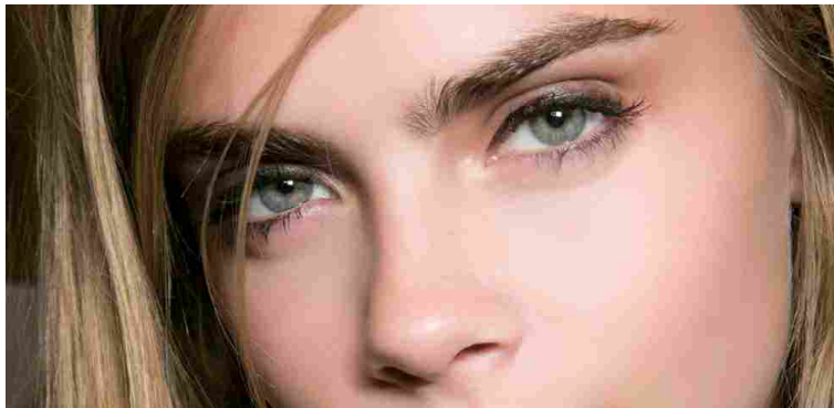
Lo sguardo magnetico della top model Cara Delevingne.

micro punta retraibile (per ritocchi nei minimi dettagli) e i liner in polvere dotati di pigmenti che colorano e infoltiscono. I “brow builder”, invece, sono speciali gel che volumizzano e strutturano anche le sopracciglia meno folte. A trucco ultimato, per un effetto long lasting basta una passata di fissatore. E, per sottolineare la plasticità del risultato, un tocco di illuminante sotto l'arcata sopraccigliare.